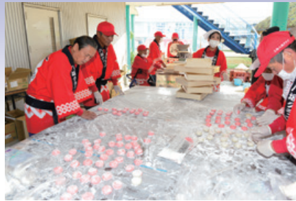
町制60周年記念事業（八坂クラブ）