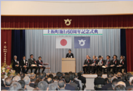
町制60周年記念式典