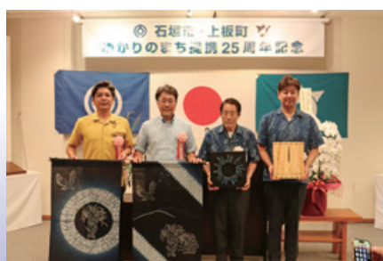
石垣市・上板町ゆかりのまち提携25周年記念式典