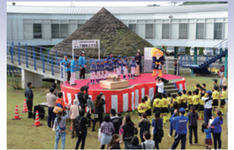
町制60周年記念事業（力餅）