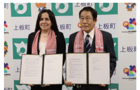
上板町（徳島県、日本）とヨルダン・ハシミテ王国との友好覚書を締結