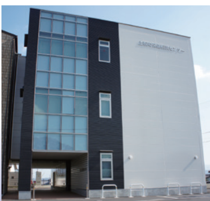
上板町保健相談センター