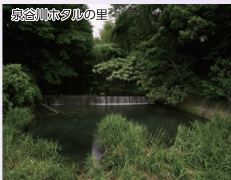
泉谷川ホタルの里