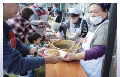
かみいた防災フェスタ2025