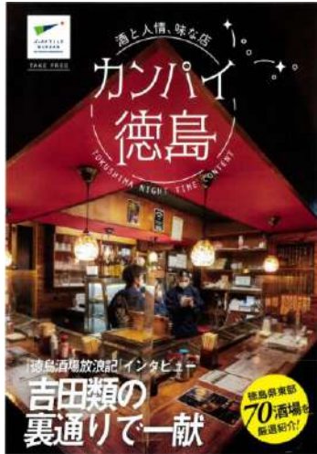
宿泊施設や観光施設で配布する小冊子