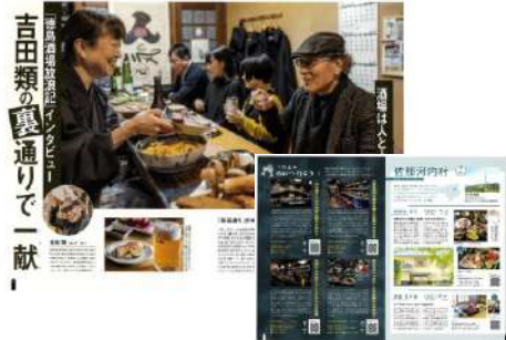
ターゲット層に訴求力のある吉田類氏を起用