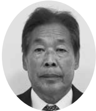
富永 志郎 議員

給与以外の勤務条件等は、地方公務員法第24条第4項の規定に基づく国及び他の地方公共団体の職員との権衡を図る観点に注意し実施する。