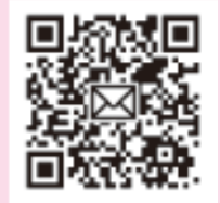
メール申込 QRコード