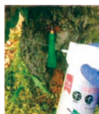
エアゾール剤の樹幹内噴射