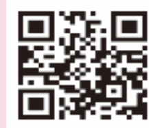
徳島県消費者協会HP

※詳しくは、徳島県消費者協会HPへ https://www.npo-tokushohi.net/