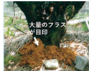
幼虫によるモモの被害樹の樹幹