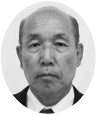
上原 勝利 議員

地域おこし協力隊は技の館で藍の栽培、染作り、藍染技術の習得を目的に受入れしている。技術習得には最適の場所で(一社)ジャパングループ上板にとっても一緒に運営できることで人件費の抑制に繋がり相乗効果を発揮していると考えている。