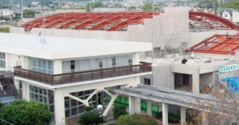
体 育 館

町財政厳しい中ではありますが、上板町の将来を担う子どもたちの安全確保の為に、町の最重要課題と位置づけ、事業を実施しております。これもひとえに町議会・学校教育関係者各位の深いご理解と P T A 保護者各位・隣接住民のご協力があったからこそであり、厚くお礼を申し上げますとともに今後尚一層のご協力をお願いします。