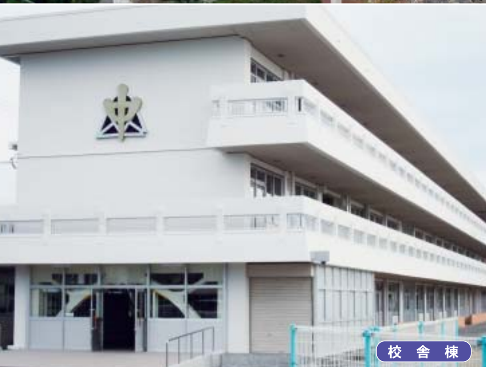
校 舎 棟

上板町の幼小中学校の耐震化状況については、上板町ホームページでご覧になれます。 http://www.townkamiita.jp/